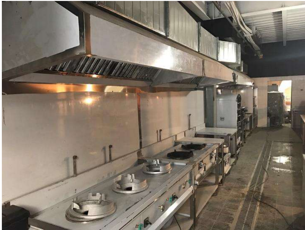
圖5 廚房排氣裝置（示意）