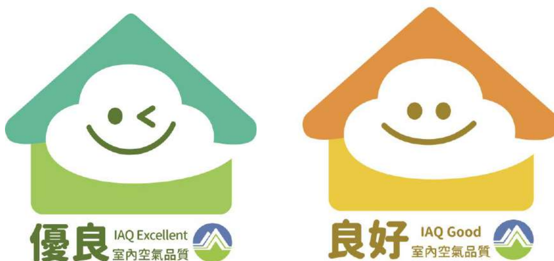
圖10 室內空氣品質自主管理標章 優良級(左)、良好級(右)

本要點明定公私場所之自主管理標章分級、申請、審查、使用管理等事項，詳見附件一所示。凡申請標章，應營造優質室內空氣品質，據以執行維護管理計畫，並委請環保署認可之檢驗測定機構依「公告場所室內空氣品質檢驗測定管理辦法」進行檢測後，出具合格檢測報告，可申請標章，如符合本要點規定，經直轄市、縣（市）主管機關審查同意後，將授予標章使用權，並可張貼標章於場所出入口，提高企業品牌形象。標章申請流程及標章規範如圖11及圖12所示。