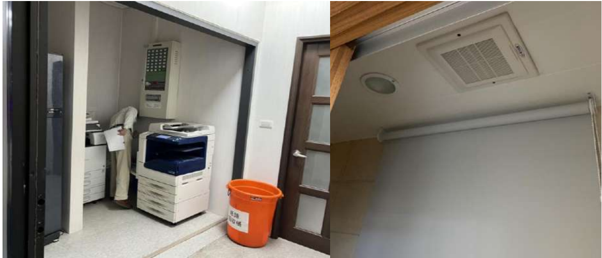
圖7 影印機及排風扇設置 (示意)