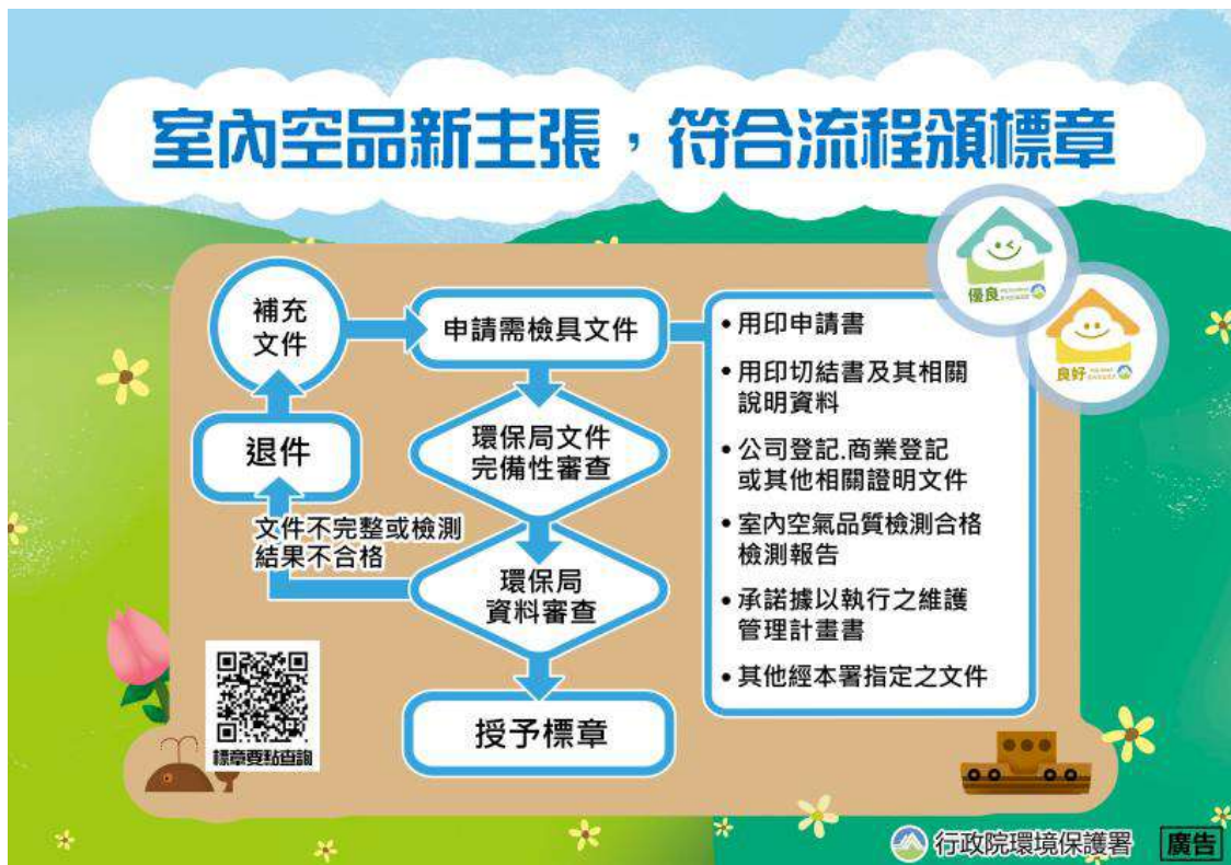
圖11 室內空氣品質自主管理標章申請流程