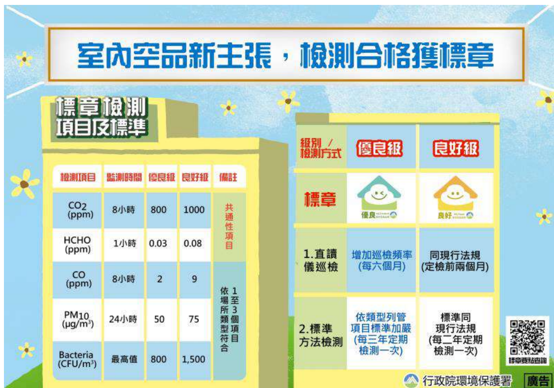
圖12 室內空氣品質自主管理標章規範