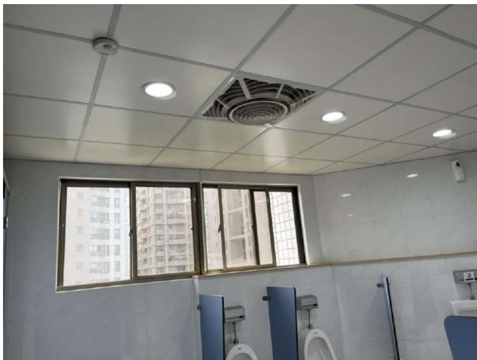
圖6 廁所排風與開窗配置（示意）