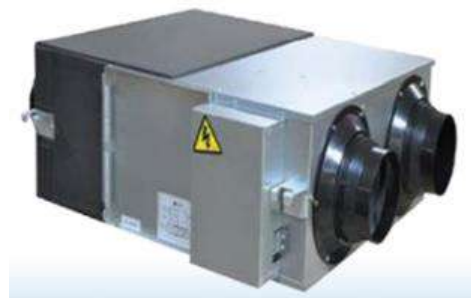
圖4 全熱交換器（示意）