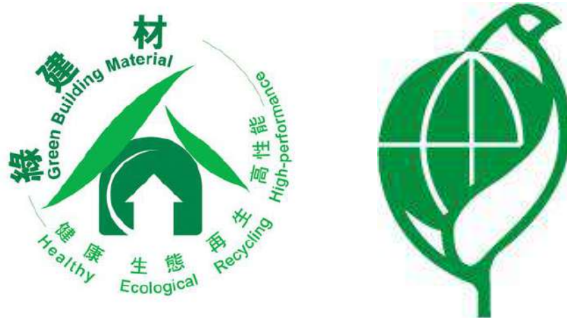
圖2 綠建材標章（左）、環保標章（右）